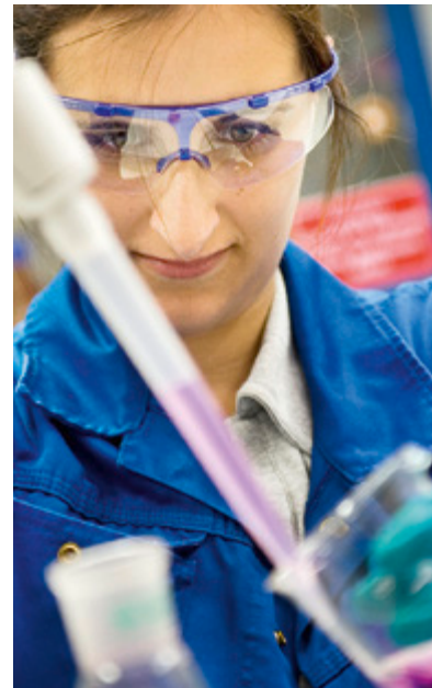
Dow produziert im Werk Stade den für CFK wichtigen Klebstoff Epokzytharz.

Beim Thema Hafen wird der Wirtschaftsförderer hellwach: „Schiffe, die nach Hamburg fahren, fahren alle an uns vorbei. Das muss doch nicht so sein.“ Die Stadt hat erst einmal eine Seehafen Stade e.V. initiiert und ist – selbstverständlich – auch als Mitglied dabei.